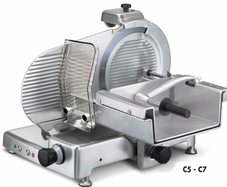
C5 - C7