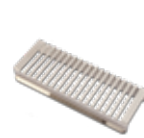
Easy, para la creación del vacío externo