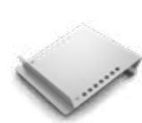
Estantes Planos Inclinados